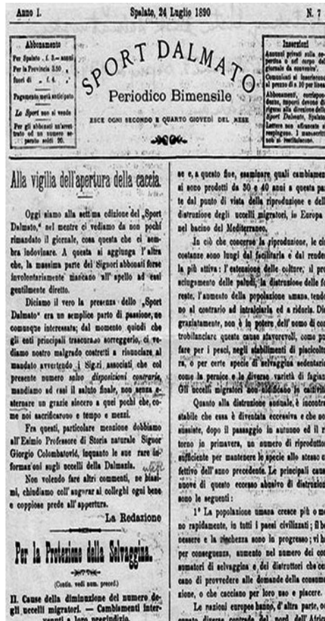
Slika3. Sport Dalmato.

Obrađivao je različite teme o svim važnijim sportskim događajima u Dalmaciji, posebno o lovačkom sportu. Uz to bile su zastupljene i teme iz ribolova, planinarstva, tjelovježbe, mačevanja, biciklizma, pomorskih sportova, konjičkom sportu itd. Nekoliko mjeseci kasnije, u listopadu 1890. godine, u Zagrebu počinje izlaziti mjesečnik „Gimnastika - list za školsku i društvenu gimnastiku“ (Slika 4). Bašić (1999) navodi da je u Zagrebu 1894. tiskan polumjesečnik „Šport – glasilo za svešportske struke“, 1903. „Hrvatski sokol“, 1908. „Hrvatski športski list“, 1912. i 1913. izlazi „Šport i umjetnost“, 1919. „Sokolskivjesnik“ i „Jugoslavenskišport“. U Osijeku 1920. izlazi „Športskitjednik“, u Zagrebu 1921. „Zagrebačkišportskilist“, u Osijeku 1921. „Slavonskišport“, a 1923. „Športskilist“ („Slavonskišportskilist“), u Karlovcu 1923. „Karlovački šport“, u Osijeku 1924. „Športista“, u Zagrebu 1925. i 1944. „Hrvatskišport“, 1925. „Športskarepublika“, 1929. u Srijemskoj Mitrovici „Mitrovačkišport“, u Zagrebu 1928. „Športskilist“, u Osijeku 1928. „Športskitjednik“, u Slavonskoj Požegi 1934. „Športskigubec“, u Zagrebu 1935. „Športskenovine“, a 1940. „Športikorzo“ i „Športsko-ribarskivjesnik“. Zanimljivo je da mnogi časopisi sadrže u naslovu riječ „šport“.