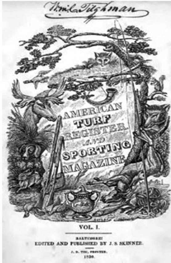
Slika 2. American Turf Register and Sporting Magazine